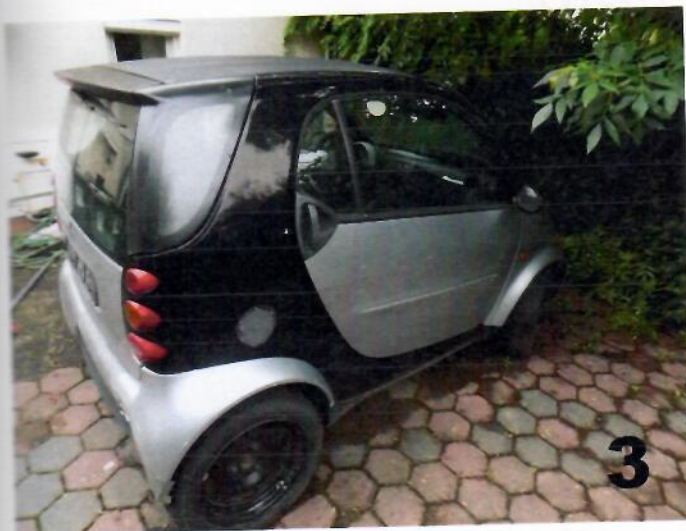
3. SMART PURE – Desna bočna strana