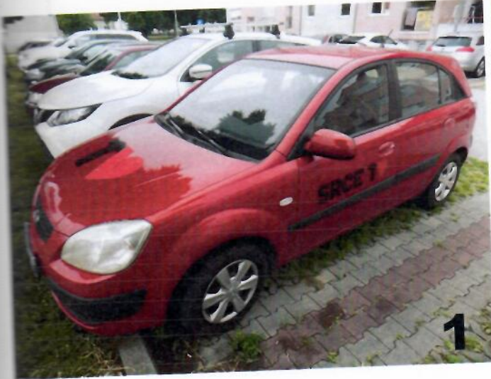
1. KIA RIO – Lijeva bočna strana