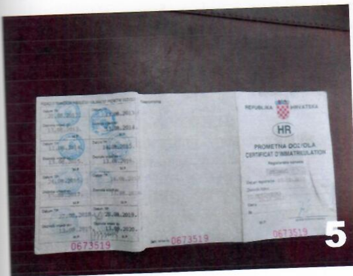
5. KIA RIO – Prometna dozvola