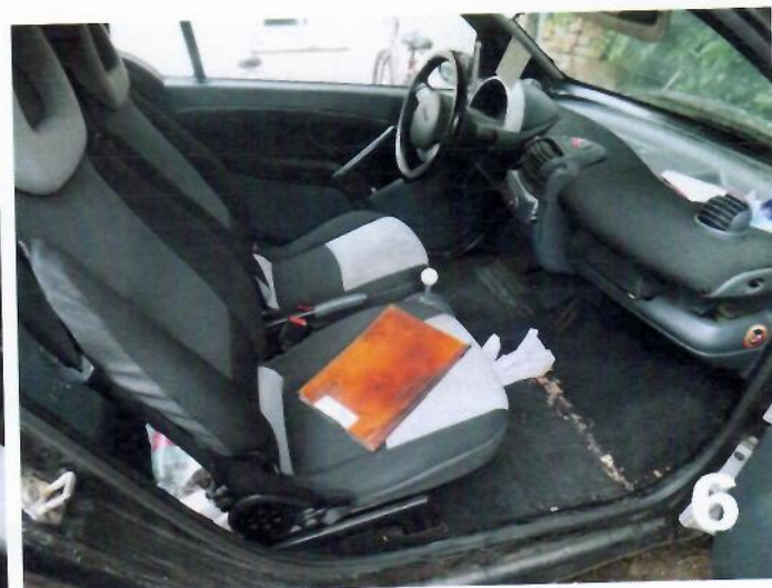
6. SMART PURE – Unutrašnjost vozila