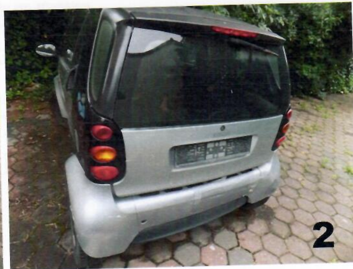
2. SMART PURE – Zadnja strana