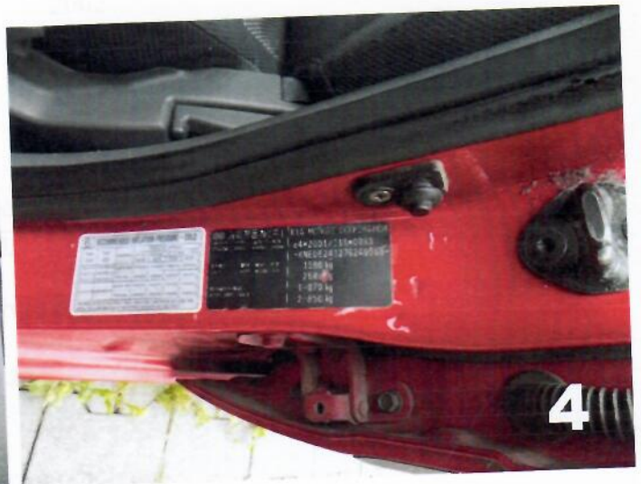
4. KIA RIO – Broj šasiije