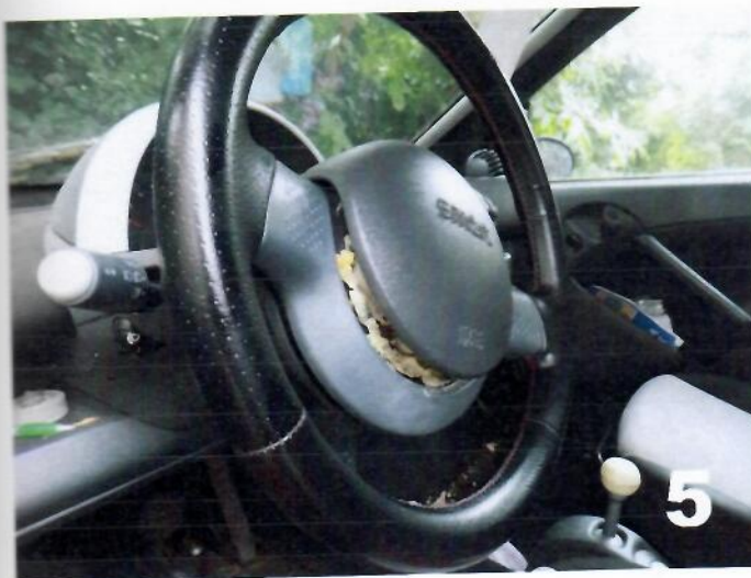
5. SMART PURE – Oštećenost volana