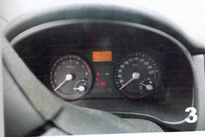
3. KIA RIO – Kilometar sat