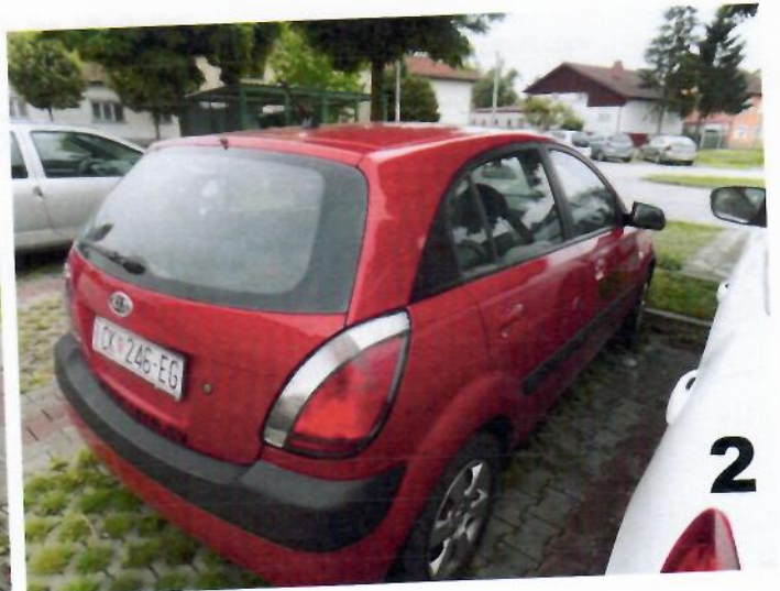
2. KIA RIO – Bočna desna strana