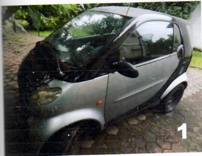
1. SMART PURE – Lijeva bočna strana